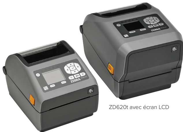
ZD620d avec écran LCD

Lorsque la priorité est à la qualité d'impression, à la productivité, à la flexibilité des applications et à la simplicité de la gestion, la ZD620 est idéale. Nouvelle génération de la gamme des imprimantes de bureau Zebra, la ZD620 remplace les célèbres imprimantes GX Series et ZD500. Avec une qualité d'impression exceptionnelle et des fonctionnalités hors pair, elle n'a aucun mal à se démarquer des imprimantes de bureau conventionnelles. Déclinée en modèles thermique direct et transfert thermique et en modèles spécialement conçus pour l'industrie de la santé, l'imprimante ZD620 s'intègre dans les environnements les plus divers. Elle offre la plupart des fonctions standard de toute imprimante de bureau Zebra, ainsi qu'une interface utilisateur facultative à 10 boutons sur écran couleur LCD, qui vous informe en permanence sur la configuration et l'état du périphérique. La ZD620 exploite Link-OS® et est prise en charge par Print DNA, puissante suite d'applications, d'utilitaires et d'outils de développement qui améliore l'expérience d'impression, grâce à une meilleure performance, une gestion à distance simplifiée et une intégration plus aisée. La Zebra ZD620 offre la vitesse d'impression, la qualité d'impression et la gérabilité indispensables à la progression de votre activité.